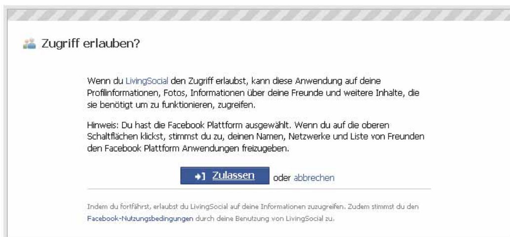
Abb: Facebook macht auf die Einbindung Dritter bei Anwendungen aufmerksam (Quelle: www.facebook.com )