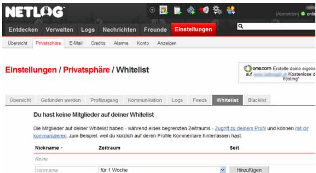
Abb.: Whitelist in Netlog